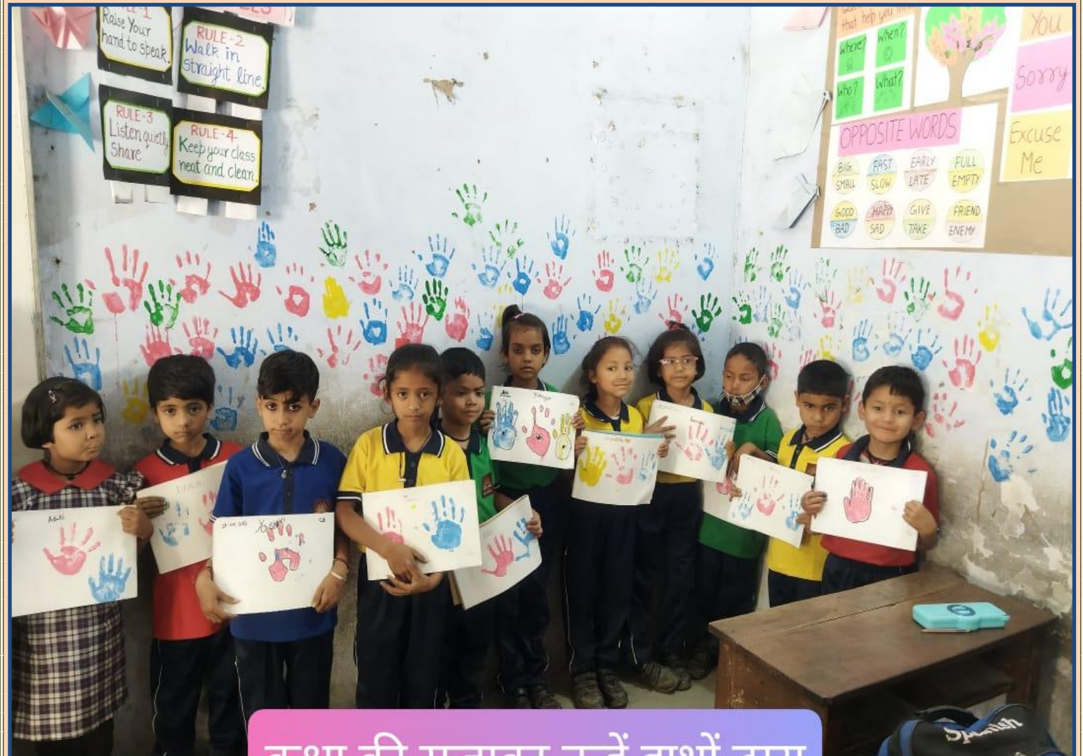
कक्षा की सजावट नन्हें हाथों द्वारा